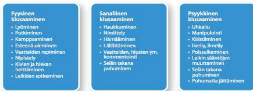
KUVIO 1: Kiusaamisen muodot (Kirves & Stoor-Grenner 2010b, 6)